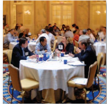
IFDA 는 많은 프로그램에 토론 시간을 할당하여 잘 활용하고 있습니다. 이러한 토론 시간을 통해 동종업계의 경영진 및 실무자들이 현안과 도전적인 상황들을 공유하고, 나아가서는 모든 기업에 적용 할 수 있는 솔루션을 도출할 수 있는 기회가 될 수 있기 때문입니다. IFDA KOREA 도 한국 내 유통기업들에게 유사한 토론 또는 세미나 프로그램을 우선적으로 1 년에 약 4 회 정도 수행할 예정입니다.