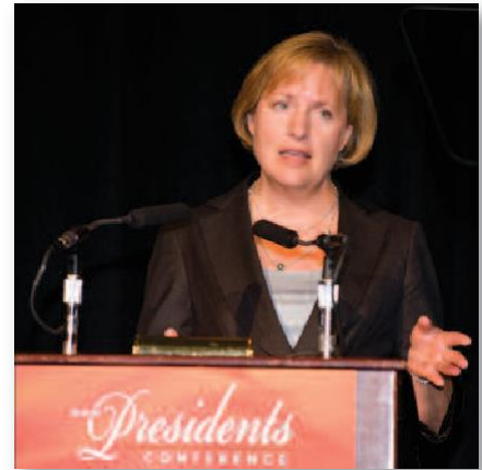
BUFFALO WILD WINGS 의 대표이사 및 회장인 샬리 스미스가 최근 이루어진 최고 경영진 컨퍼런스에서 고객 충성도가 높은 성공적인 체인 기업을 키우는 방법에 대해서 발표하는 모습입니다.